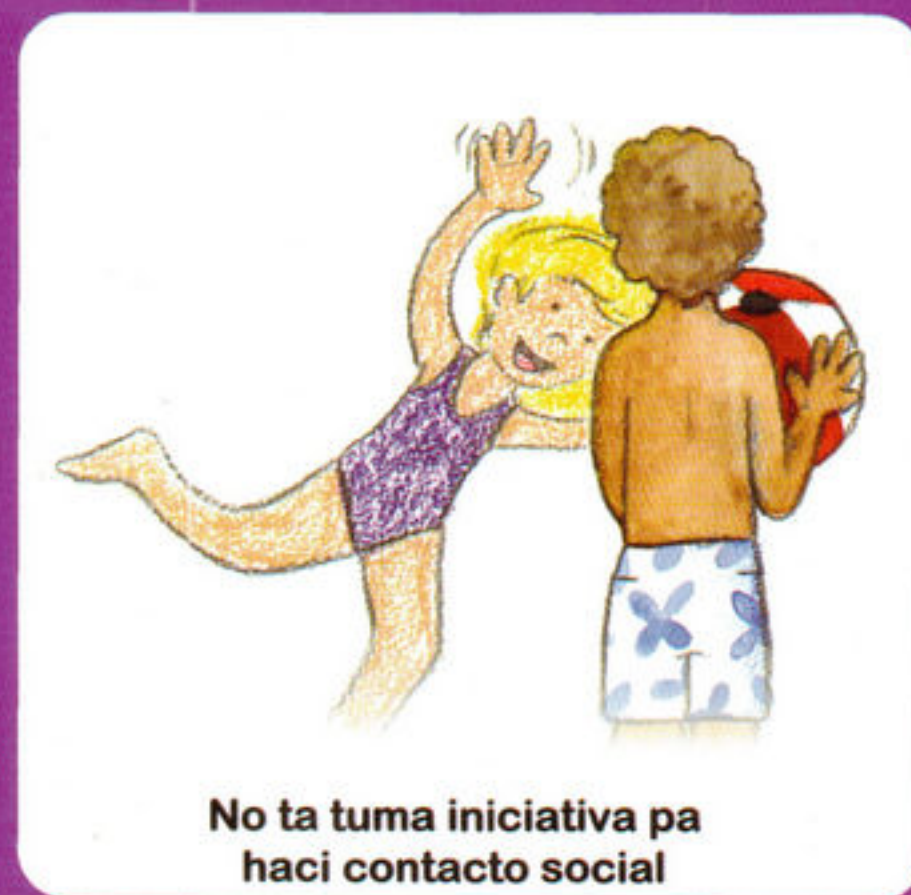
No ta tuma iniciativa pa haci contacto social